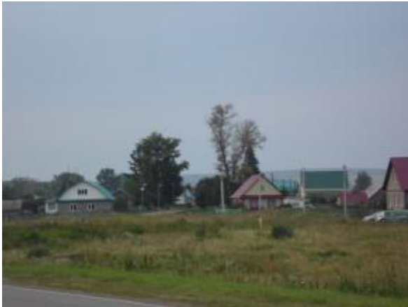
Рис.2 Село Уктеево