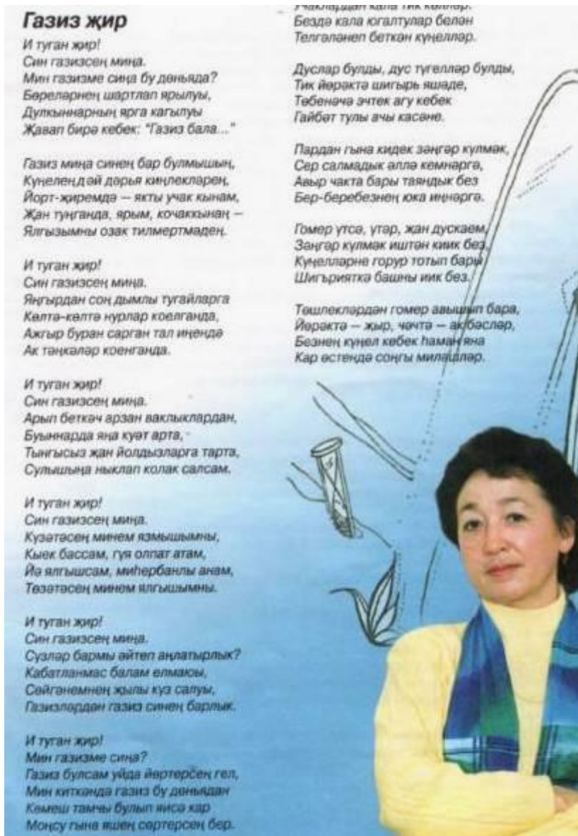
Рис.16 Журнал «Тулпар», 2002, №1