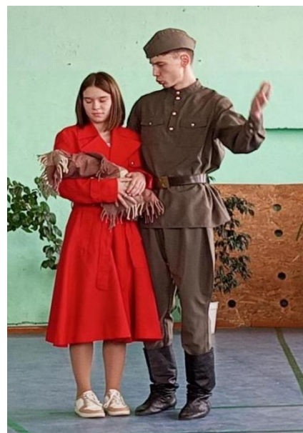
Рис. 28 Постановка “Һуңғы сер”