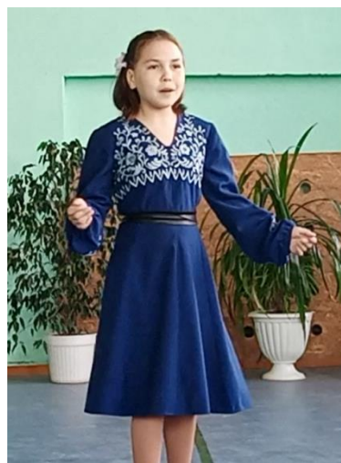
Рис. 27 Постановка “Ал кэрэк, гөл кэрэк”