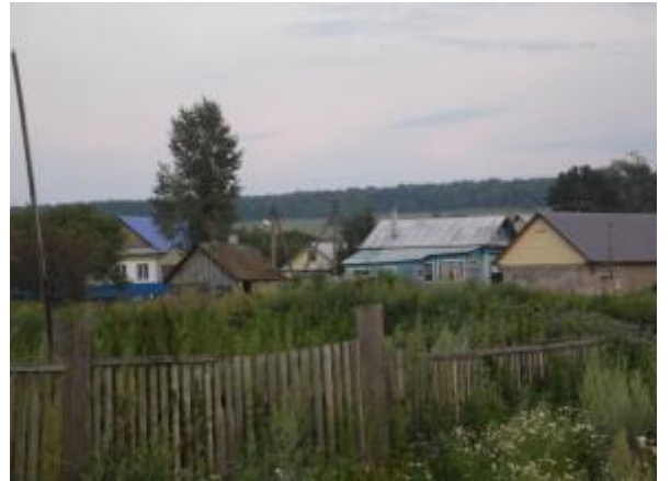
Рис.1 Село Уктеево