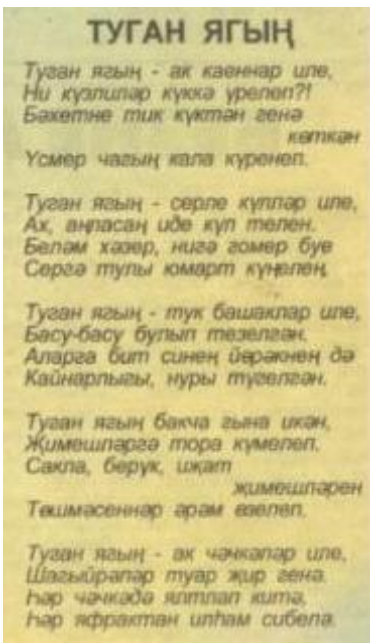
Рис.3 Газета “Өмет”, №12, 2011