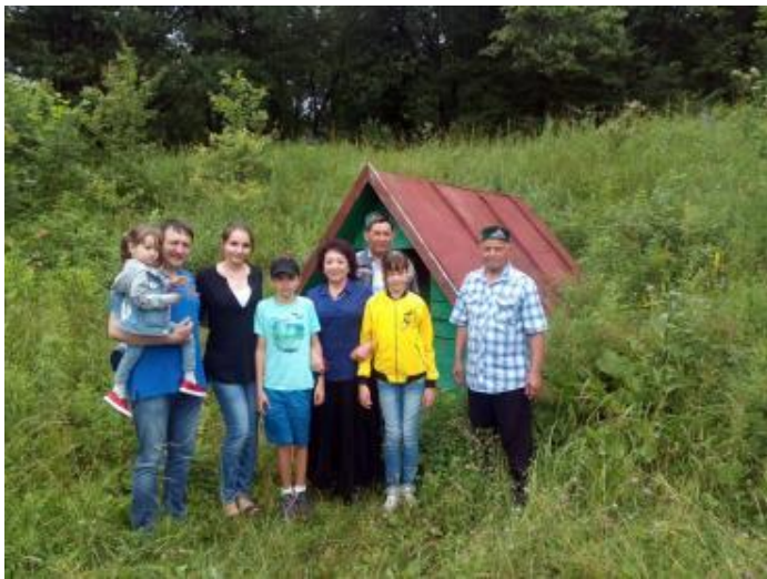
Рис.8 Родник Биктимера (2018)