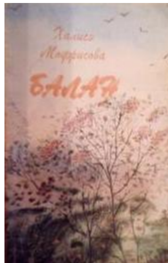
Рис.4 Сборник стихов Х.Мударисовой «Балан»