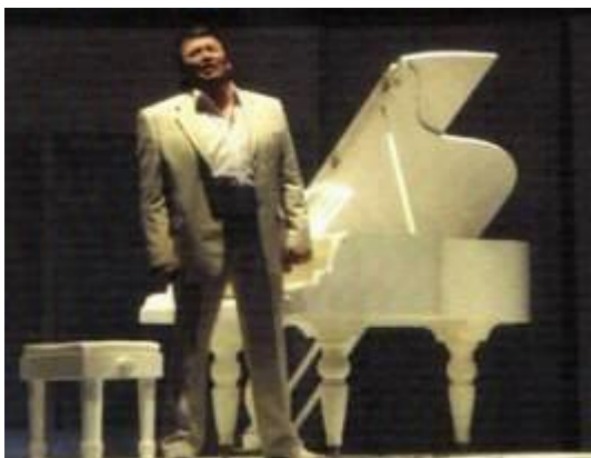
Рис.12 Спектакль “Бэхет хакы”. Ф.Гафаров