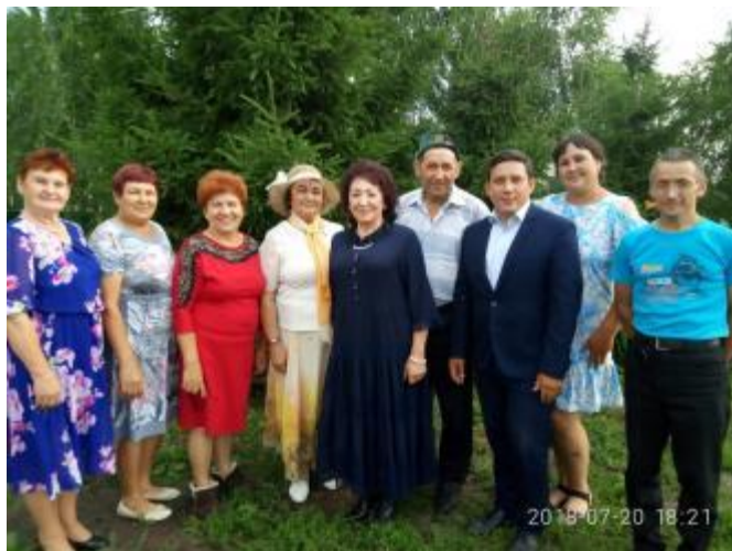
65 лет (2018)

Атам-бабам төйәге был, Минең дә изге йортом. Бәпесем бишеге бында, — Ышанысым—өмөтөм. Секундтар аға, минуттар. Йылдарым, ғүмерзәрем, Үземдән һуң усағымда Калырмы күмерзәрем? Башкалар йылына алырлык Булырмы ғүмерзәрем?! — тигән