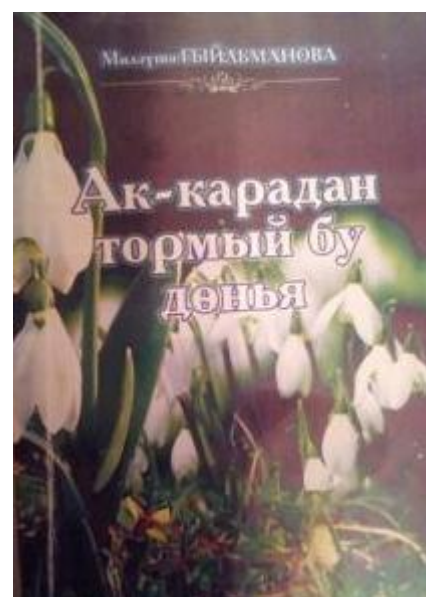
Рис.25 Сборник стихов М.Гильмановой